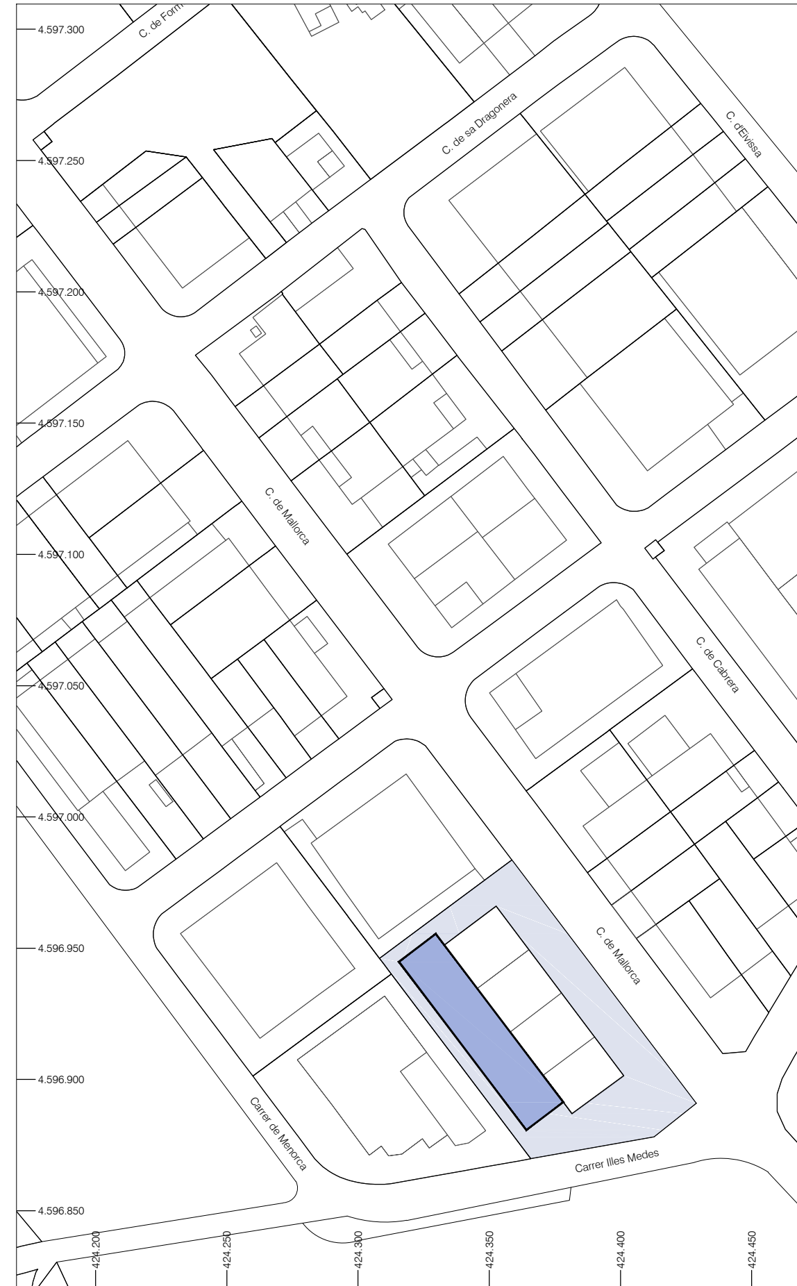
EMPLAÇAMENT Escala 1/2.000