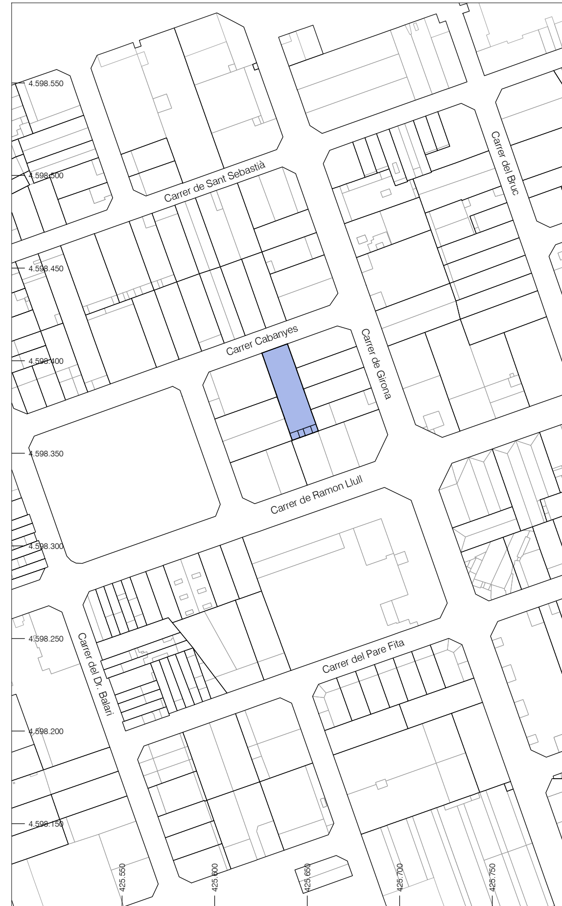
EMPLAÇAMENT Escala 1/2000

Notes Generals a) Aquest plànol és propietat de FONT ENGINYERIA. No pot ser utilitzat, ni reproduït total o parcialment sense l'autorització expressa de FONT ENGINYERIA. b) Les cotes escrites tenen més validesa que les mesurades als plànols. c) Totes les dimensions s'han de comprovar a obra. d) Possibles contradiccions entre documents de projecte han de ser comunicats immediatament a la D.F. que en determinarà la seva validesa o prioritat. e) Els plànols han de ser llegits en conjunt amb tots els documents rellevants del projecte, inclosa la documentació escrita, plànols d'estructura i instal·lacions. f) Prohibida la reproducció o difusió total o parcial de qualsevol document de projecte sense l'autorització expressa de la D.F. g) Les bases informàtiques dels documents de projecte són propietat intel·lectual dels autors.